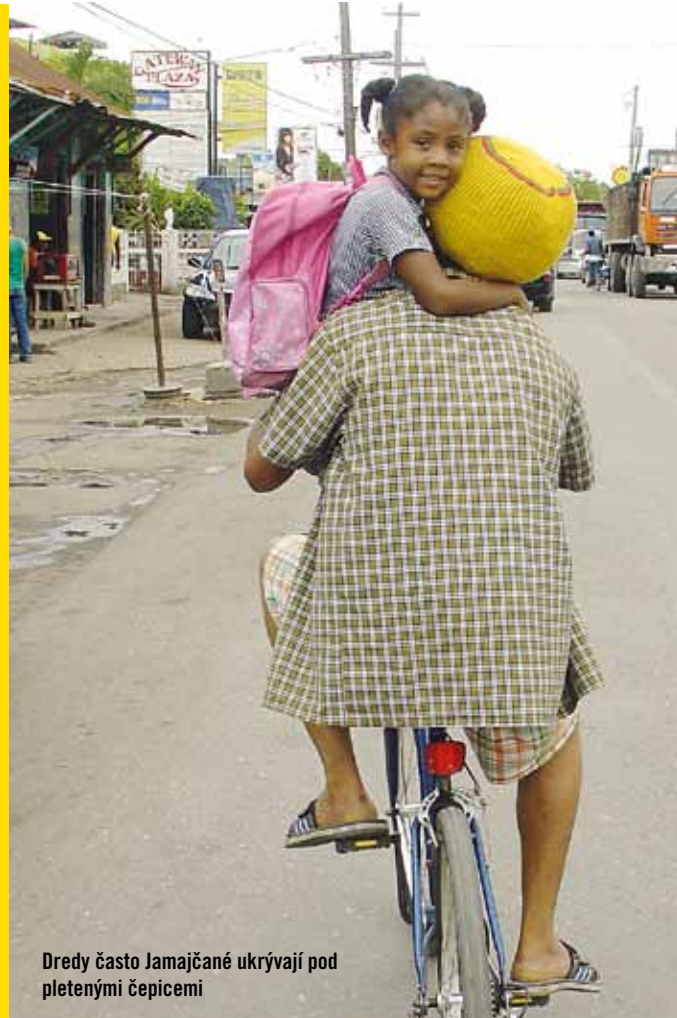
Dredy často Jamajčané ukrývají pod pletenými čepicemi

přeplněným a špinavým centrem, vynechali jeho krásné koloniální památky, viděli jen jeden starý most po cestě a nabrali směr Mandeville.