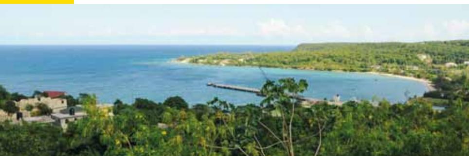
Zátoka u města Rio Bueno

Opatrní jsme většinou byli, před západem slunce jsme si vždy snažili najít ubytování a ve tmě se nikde už moc nepohybovali. Jen tady zrovna nebylo kde opřít kola u vchodu.