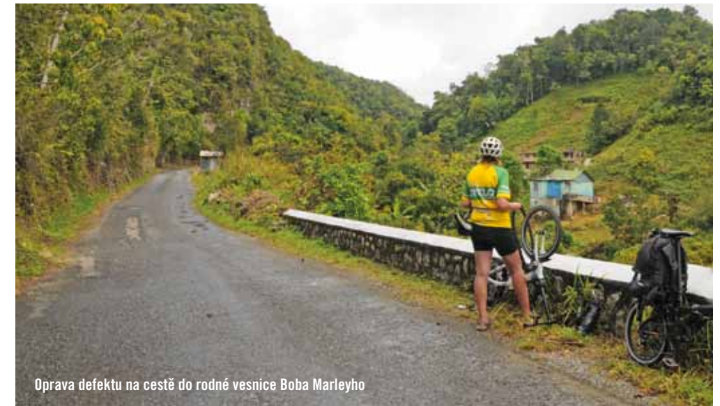
Oprava defektu na cestě do rodné vesnice Boba Marleyho

Nikdy jsem se na dovolené necítila šťastněji než během těchto čtrnácti dní na Jamajce. Že by za to mohla ta neustálá inhalace všudypřítomné vůně marihuany, která zmizela až po zaklapnutí dveří letadla?