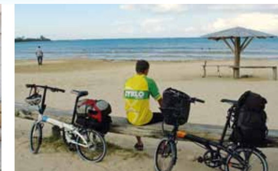
Plážička v San Ann's Bay

že si přivydělají. Kolem domu Boba Marleyho jich bylo samozřejmě nejvíce. Zbavit se jich šlo jen těžce, ale našťastí parkoviště u domu zpěváka bylo za vysokou zdí a hlídané ostrahou. Každé přijíždějící auto bylo před branou hlasitě vítáno a jedinou dírou ve zdi všem kluci nabízeli marihuanu. V areálu, kde se nachází kromě rodného Bobova domu i jeho mauzoleum, se rozléhala živá hudba Marleyho písniček a bílí návštěvníci se tu střídali jak na běžícím páse. V celém komplexu se můžete pohybovat pouze s průvodcem, který po už tak drahé prohlídce po vás ještě žadoní další peníze.