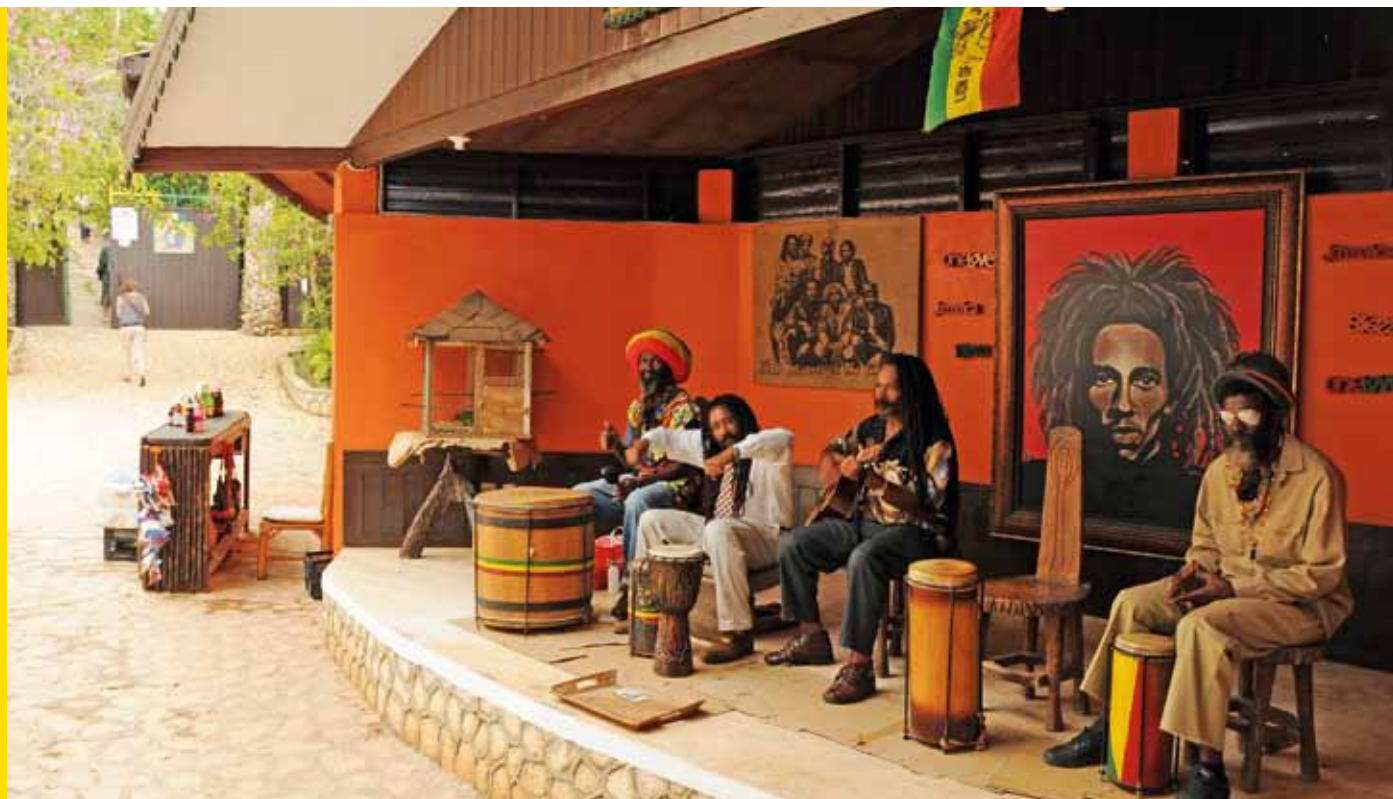
Reggae kapela pro turisty u Bobova rodného domu