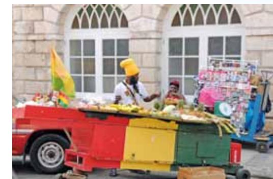
Prodáváče ovoce – Montego Bay