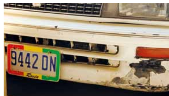
Rastamana poznáte nejen podle dreadů a jointa, ale i podle poznávací značky auta

Čekal nás průjezd Modrými horami, nejvyšším pohořím Jamajky s nejvyšší horou Middle Peak ve výšce 2254 m n. m., územím, kde skoro pořád prší, přece jen se jedná o deštivý prales, a s nejlepší světovou kávou Jamaica Blue Mountain.