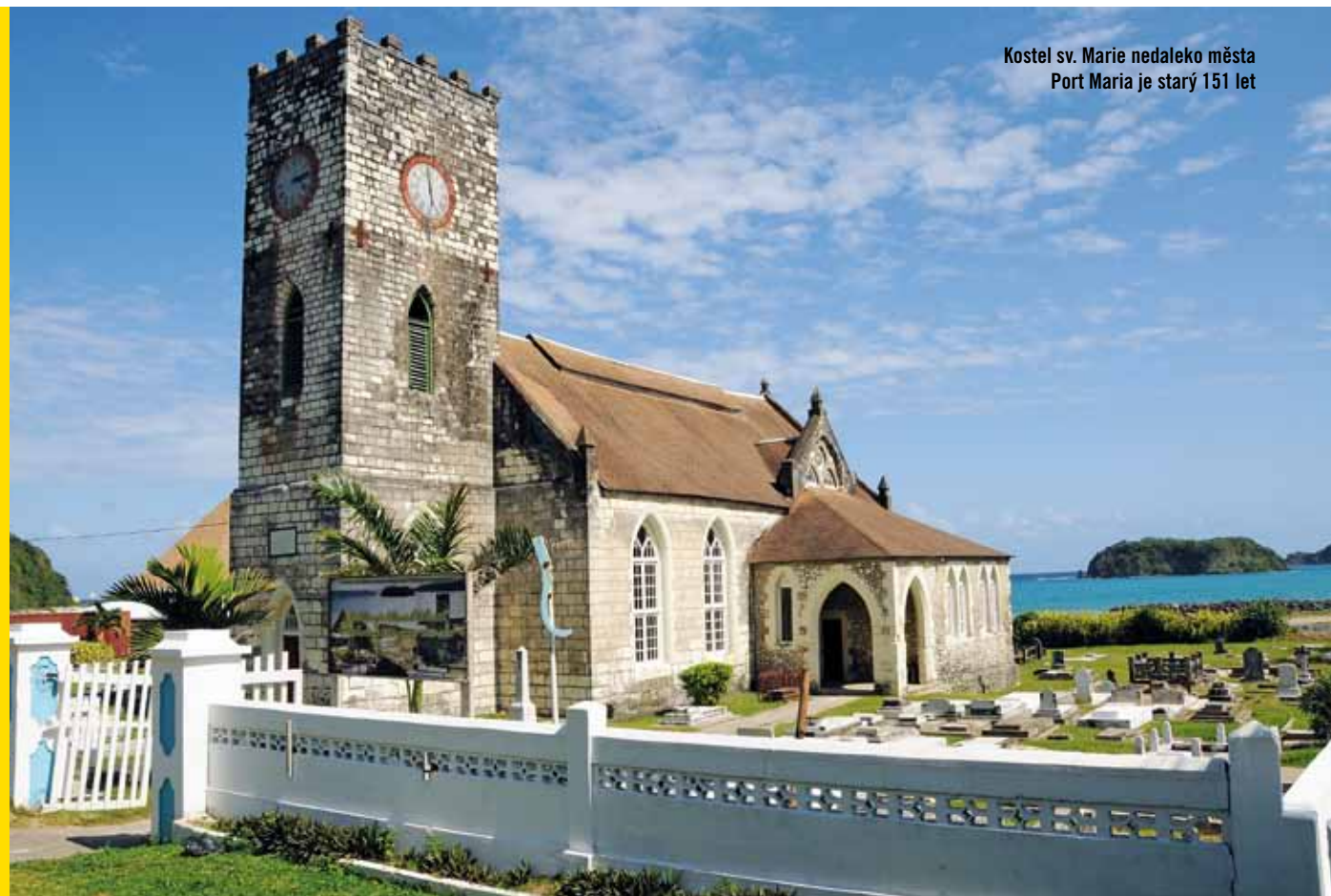
Kostel sv. Marie nedaleko města Port Maria je starý 151 let