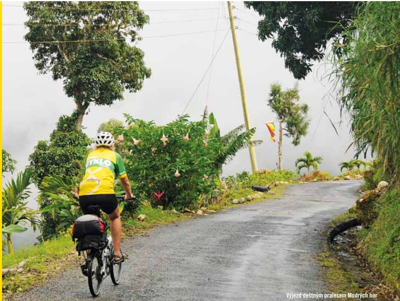
Výjezd deštým pralesem Modrých hor